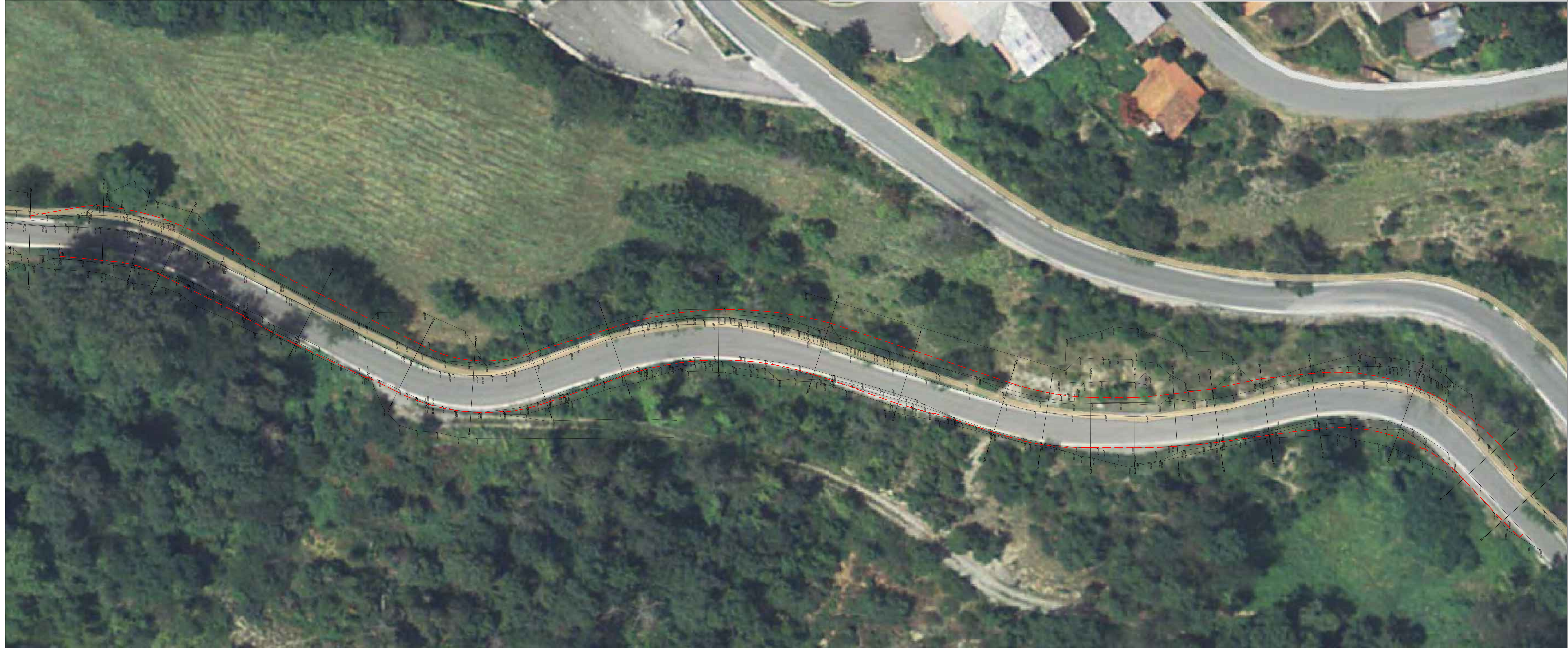
PLANIMETRIA DI RILIEVO SU ORTOFOTO